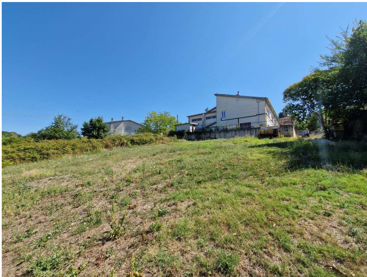
Vista interna del lotto d'intervento verso la scuola materna