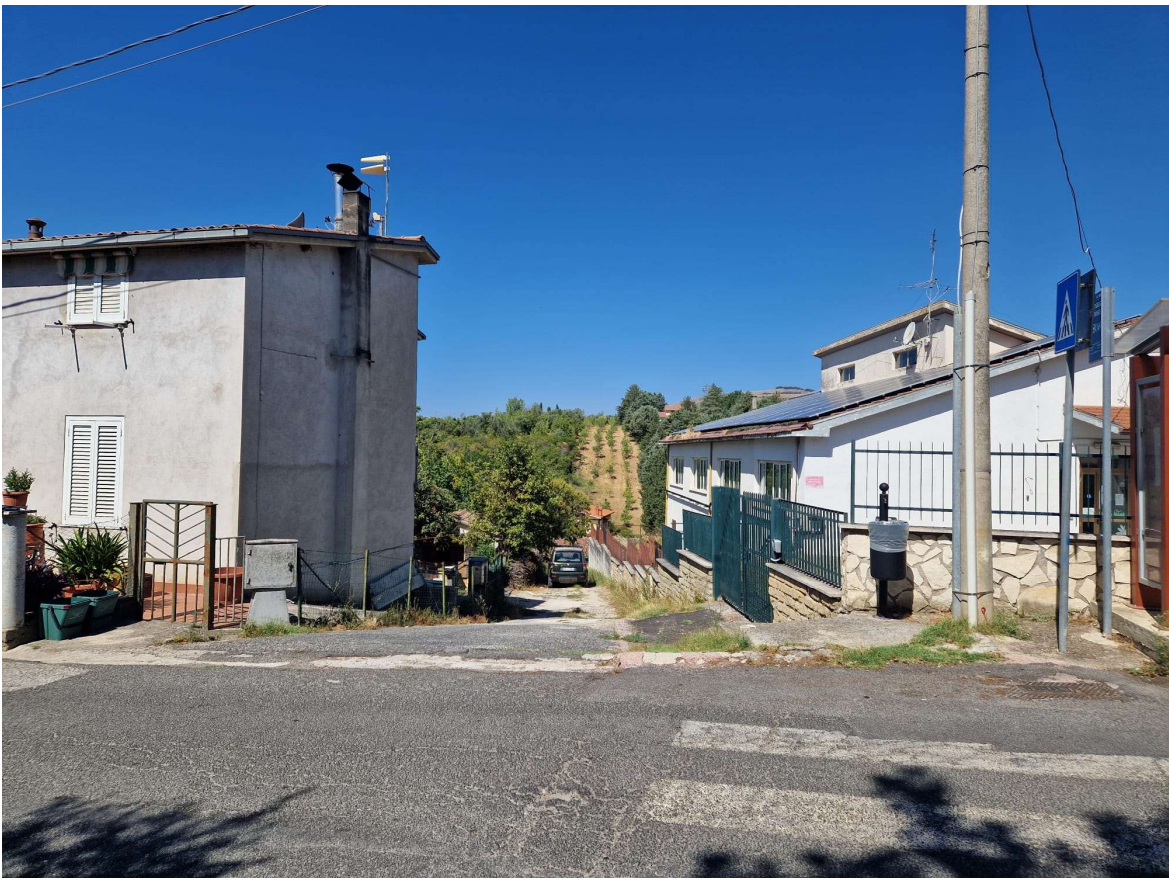
Foto 2 - Vista accesso strada interna da Via Rieti