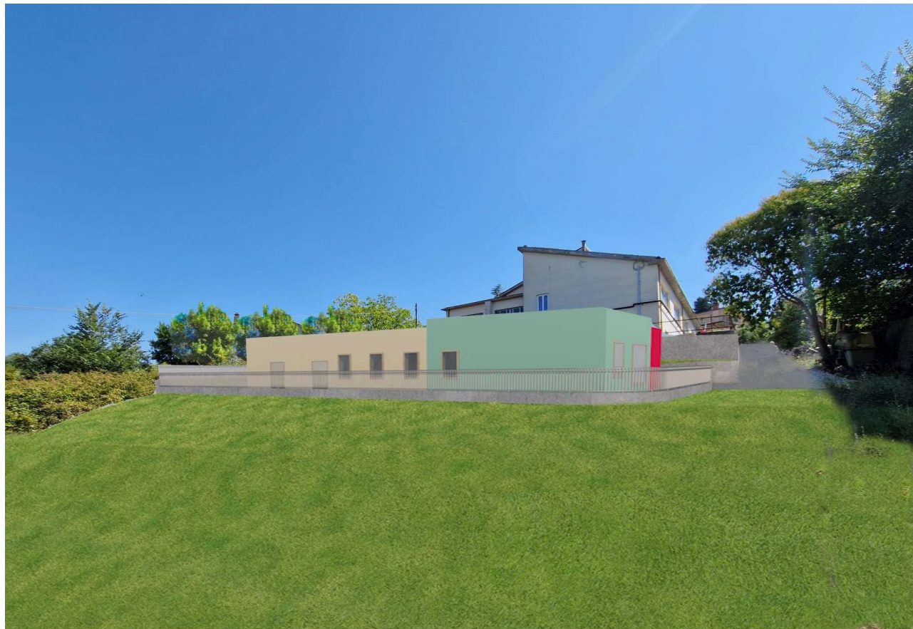
Vista interna del lotto d'intervento con inserimento fotorealistico