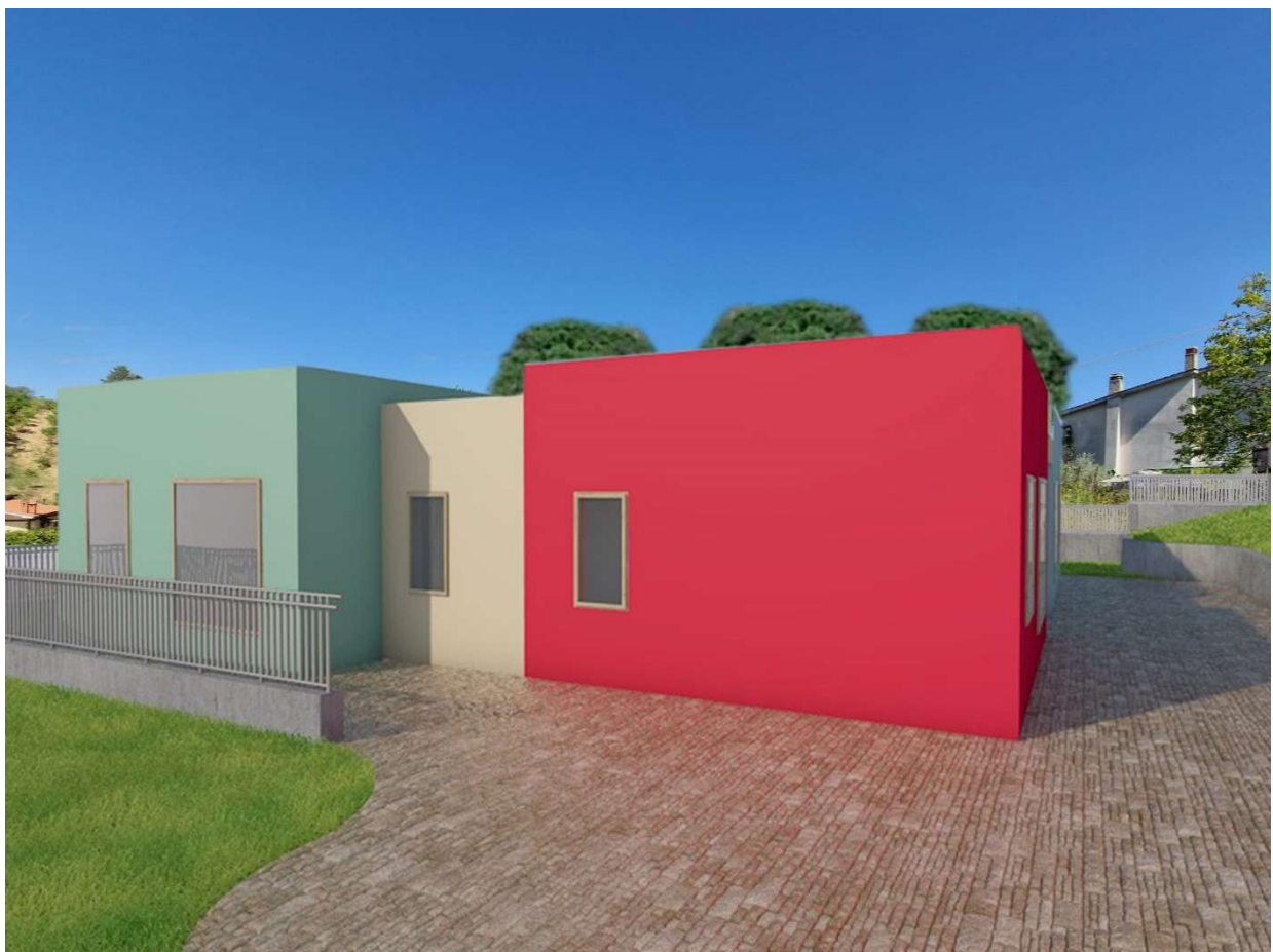
Vista interna del lotto d'intervento zona ingresso con inserimento fotorealistico