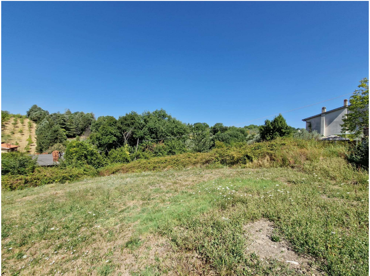
Vista interna del lotto d'intervento