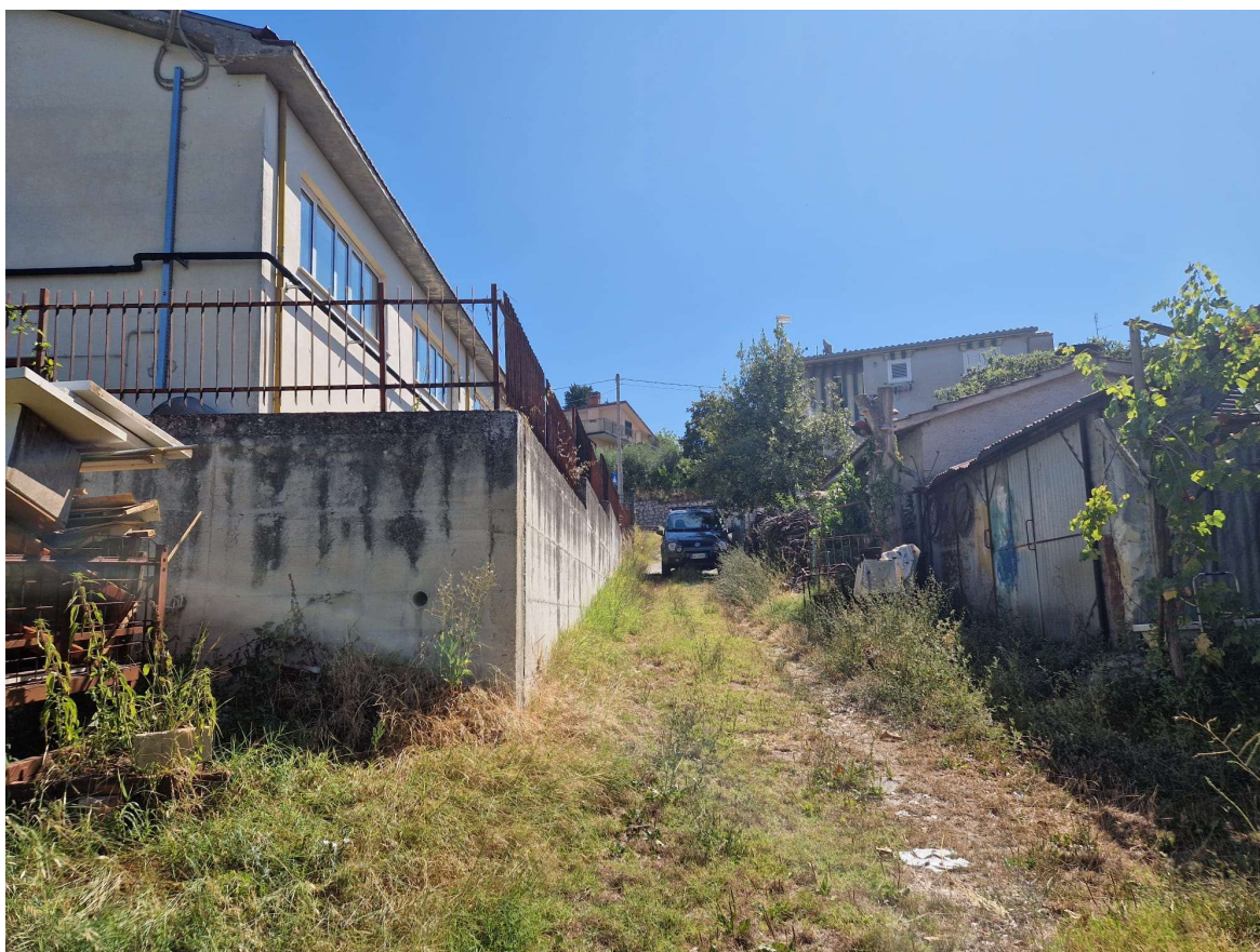
Foto 3 - Vista interna sulla strada di accesso