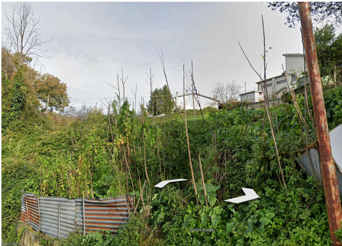
Foto 6 - Vista del lotto dalla strada sottostante