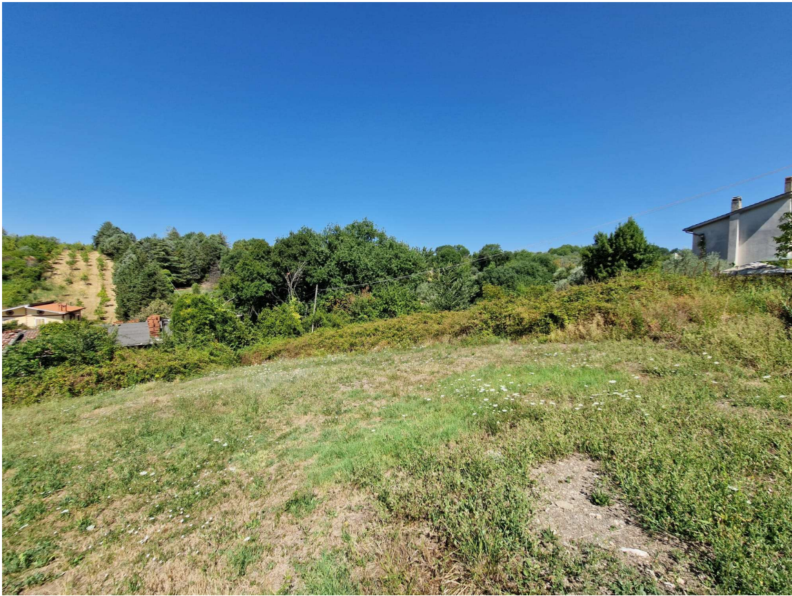
Foto 5 - Vista interna del lotto d'intervento