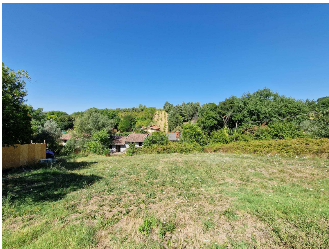
Foto 4 - Vista interna del lotto d'intervento verso la vallata sottostante