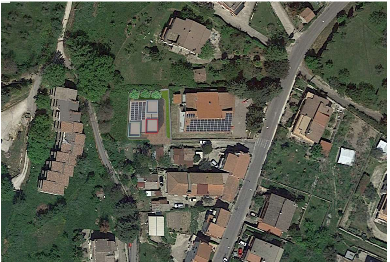
Vista aerea con inserimento fotorealistico