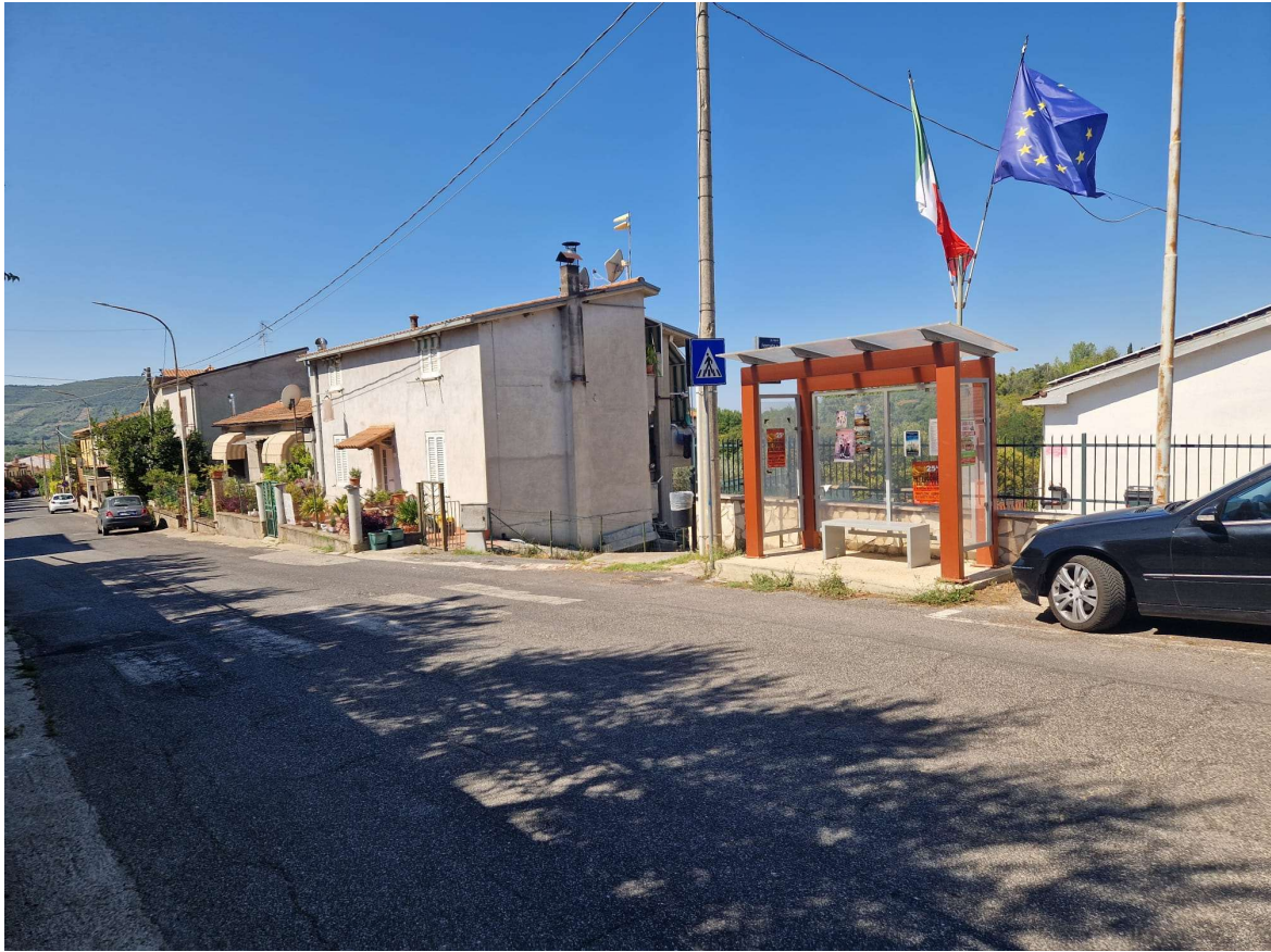
Foto 1 - Vista accesso da Via Rieti